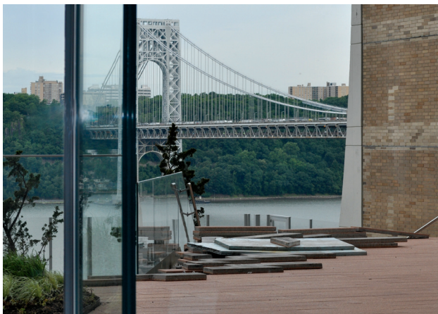
Фото 1. ISBCR-2018, вид из конференц-зала: река Гудзон, мост Дж.Вашингтона (courtesy: D. Gallagher) Photo 1. ISBCR-2018, view from the conference hall: Hudson River, George Washington Bridge (courtesy: D. Gallagher)