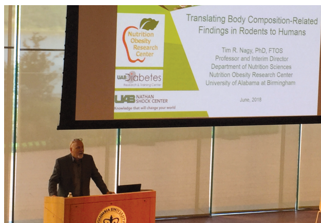
Фото 4. Лекция проф. Тимоти Надя (courtesy: D. Gallagher) Photo 4. Lecture by Prof. Tim Nagy (courtesy: D. Gallagher)